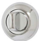
4. ПОВОРОТНИК для ночной задвижки